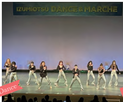
令和6年3月3日『泉大津ダンス&マルシェ』

日時 3月2日(日) 午前10時～午後5時 会場 テクスピア大阪 ※時間は変更する場合があります